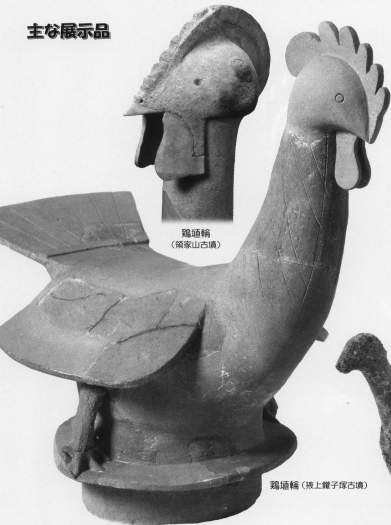
鶏埴輪 (領家山古墳)